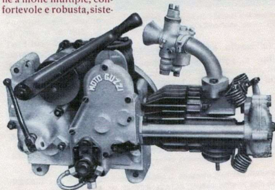
Il motore visto dal lato della distribuzione.

Ruote: Cerchi a canali e pneumatici "Pirelli" 25 x 3.00.