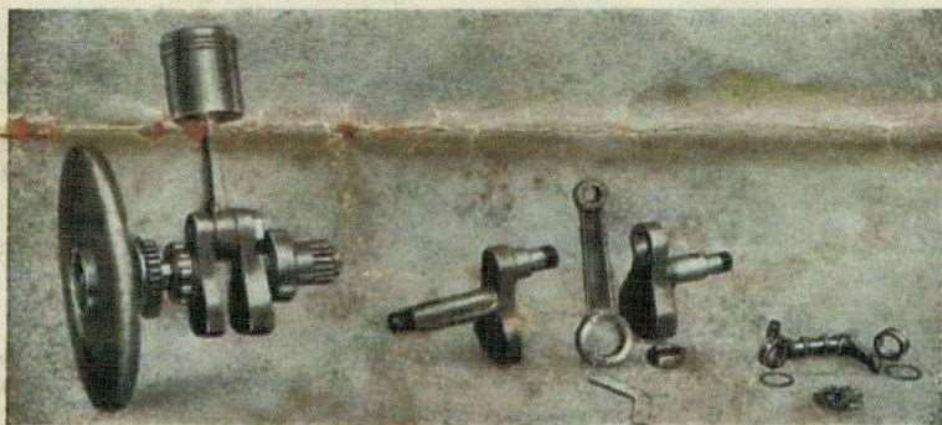
Dettagli delle parti rotanti del motore: al centro l'albero smontato ed a destra un bilanciere della distribuzione con i rulli ad ago.

Interasse: Metri 1,32. Velocità: Dal passo d'uomo a circa 100 Km. all'ora.