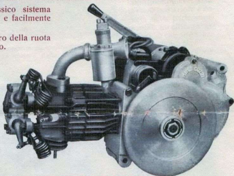
Il motore visto dal lato del volano.

Sella: Grande dimensione a molle multiple, confortevole e robusta, siste-